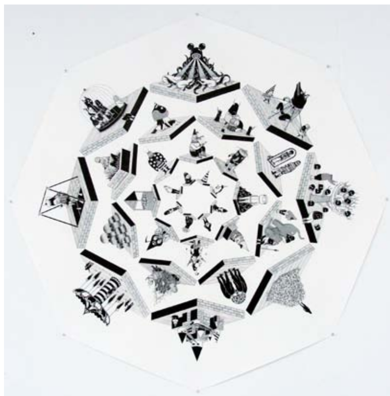
• The Wheel, 2009 Encre sur papier 130x130cm.

ou même encore Keith Haring, les œuvres des Hell'O Monsters font preuve d'une recherche spontanée et assidue où monstres multioculaires, animaux mutés, humains trépanés et autres petits bonhommes expriment une ambiance plutôt carnavalesque qu'angoissante.